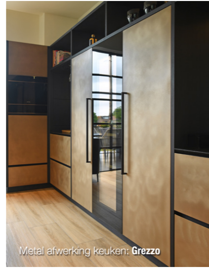
Metal afwerking keuken: Grezzo