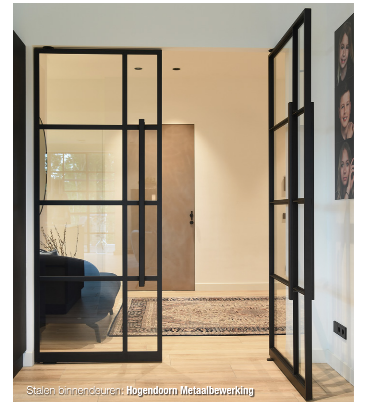
Stalen binnendeuren: Hogendoorn Metaalbewerking