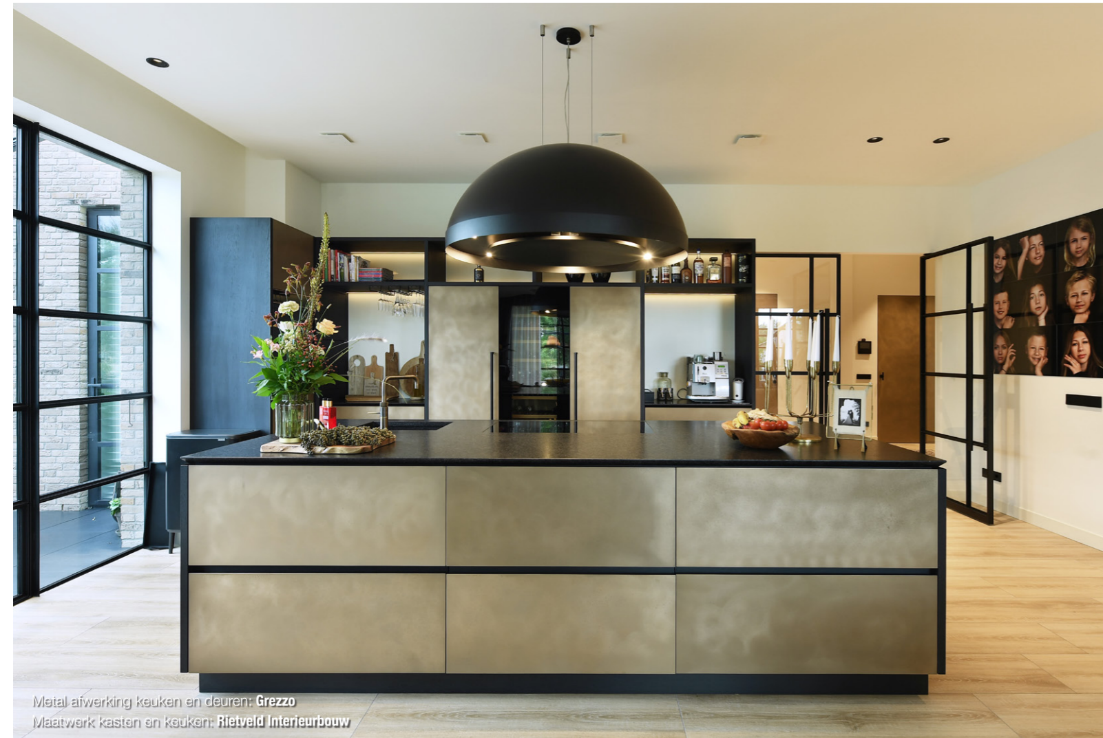
Metal afwerking keuken en deuren: Grezzo Maatwerk kasten en keukens: Rietveld Interieurbouw