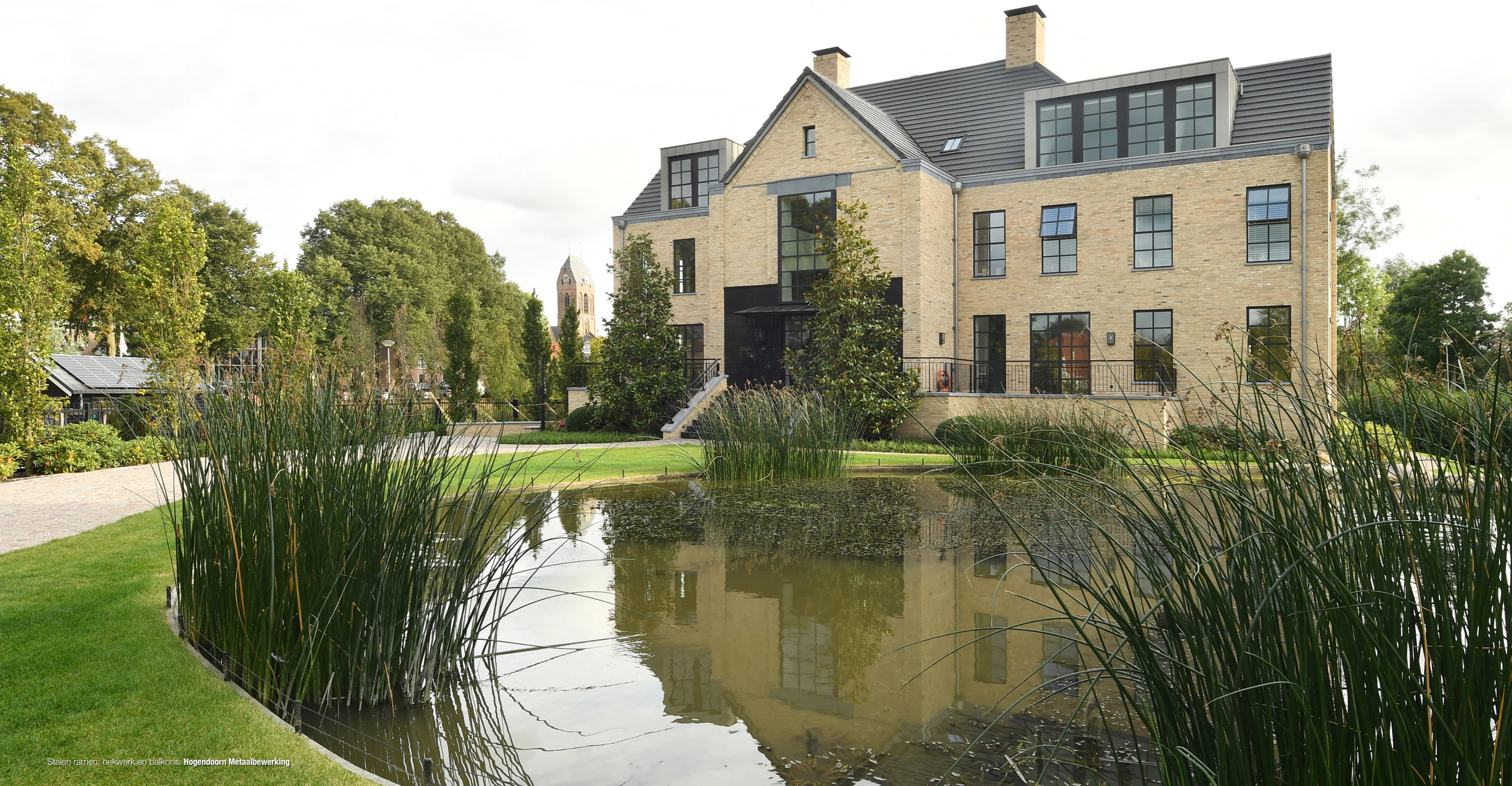
Stalen ramen, hekwerk en balkons. Hogendoorn Metaalbewerking