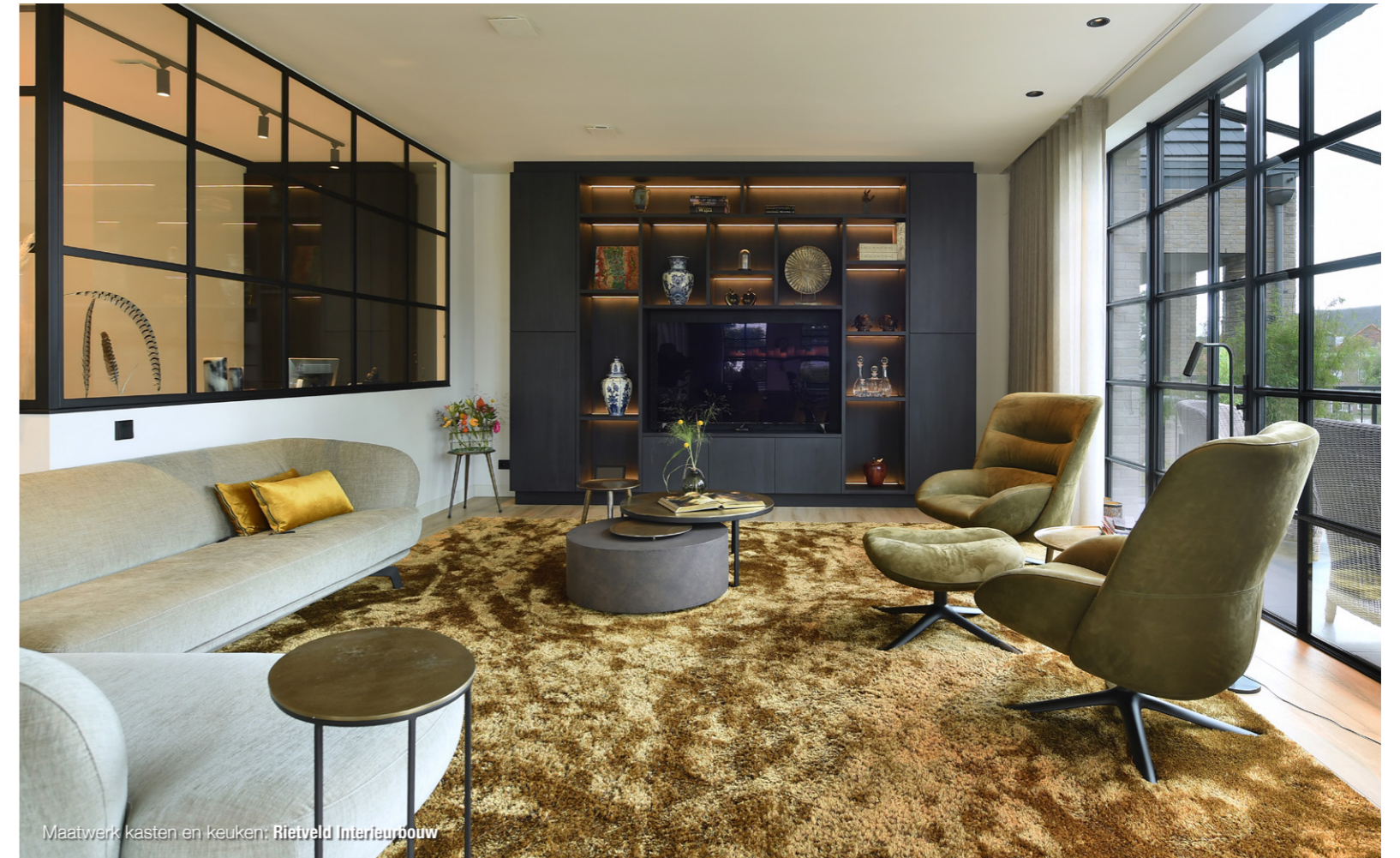
Maatwerk kasten en keukens: Rietveld Interieurbouw

hebben zelfs de keramische kookplaat helemaal naadloos in het granieten leather look aanrechtblad laten plaatsen, zodat het er strak uitziet en je het goed kunt schoonmaken." Een andere eyecatcher is de grote ronde afzuigkap van zwart metaal met ingebouwde verlichting, die eruitziet als een designlamp. Vanuit de keuken heb je zicht op de druppelvormige zwarte eikenhouten tafel met uitnodigende okergele stoelen en bank.