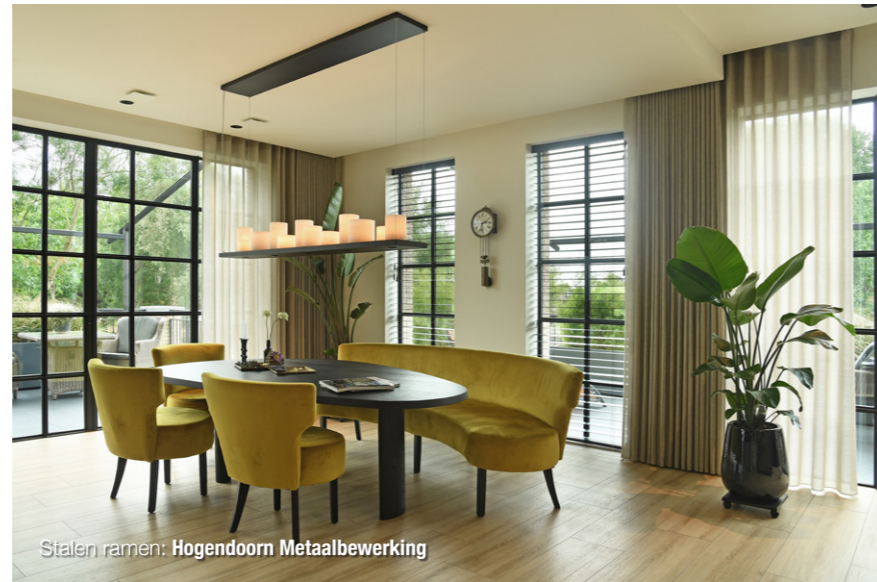
Stalen ramen: Hogendoorn Metaalbewerking